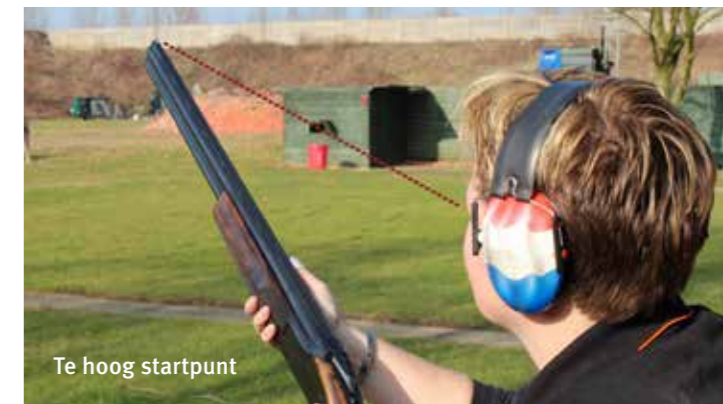
Te hoog startpunt