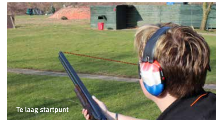
Te laag startpunt