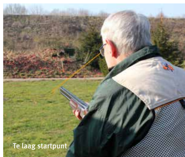
Te laag startpunt