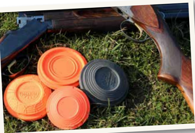
Tekst en illustratie Myrthe de Bruin

D e rabbit rolt altijd van rechts naar links. Daarbij is de rabbit anderhalve seconde zichtbaar en is de mat waarover hij rolt twintig meter lang. De afstand van de schietpost tot de mat waarover de kleiduij rolt bedraagt eveneens twintig meter. Zoals gezegd kan een rabbit ook stuiteren of 'springen'. De toelaatbare stuiterhoogte is dertig centimeter. Springt de rabbit hoger dan is het een 'no bird'. Je krijgt dan een nieuwe kleiduij.