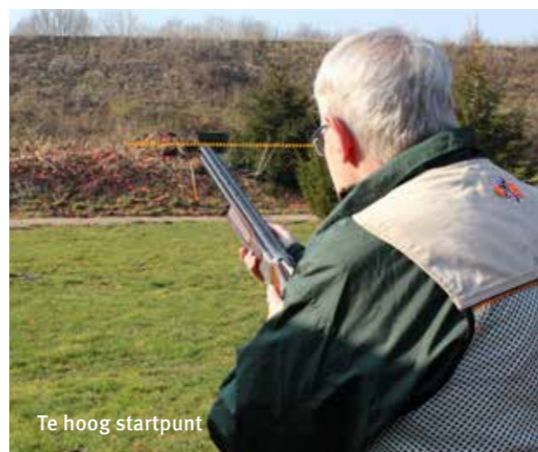
Te hoog startpunt