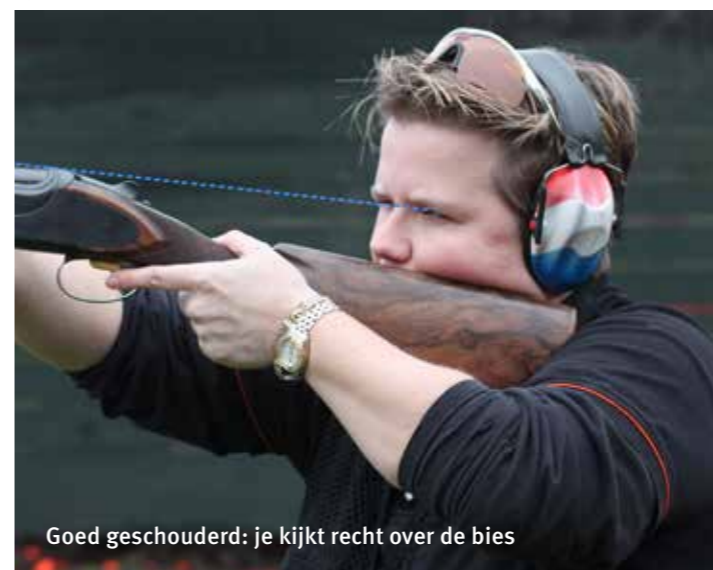
Goed geschouderd: je kijkt recht over de bies

Tip: verleng in je beweging de baan van de duif en haal de trekker pas over als je de duif gepasseerd bent. Je haalt de trekker dus over op het punt waar de duif een fractie van een seconde later vliegt. Kijk naar de duif!