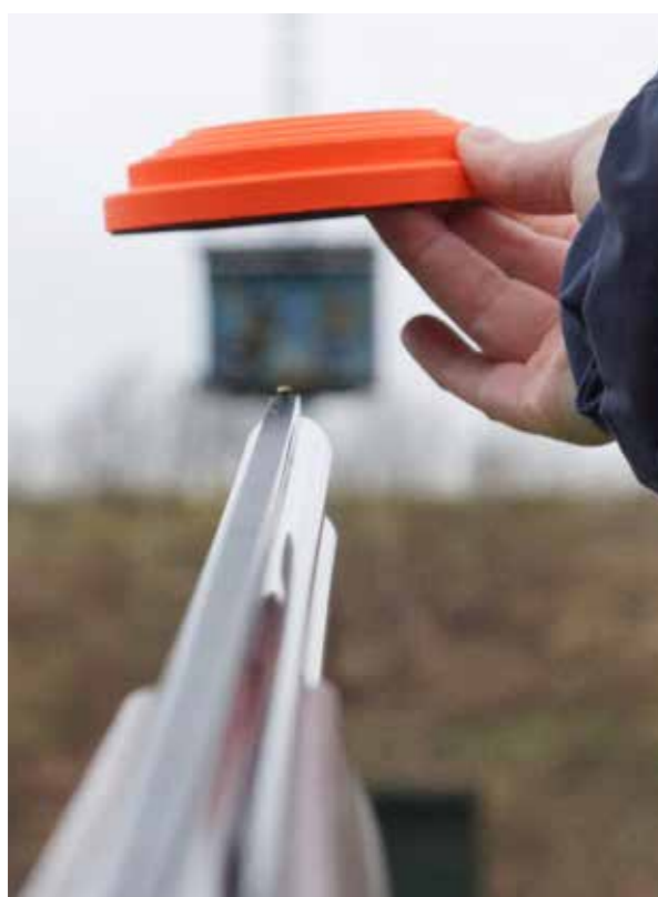
Duif laten vertrekken en achter hem aangaan

Schiettechniek inkomende duif: laten vertrekken, er achteraan, duif inhalen, net voorbij duif trekker overhalen, beweging afmaken