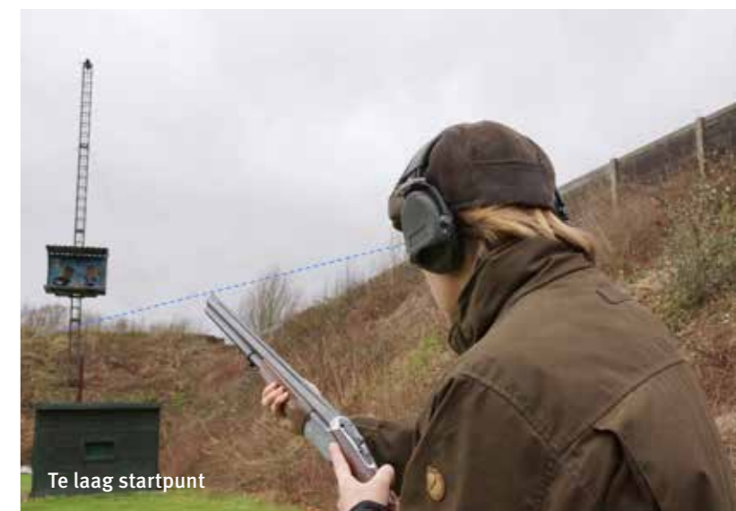
Te laag startpunt