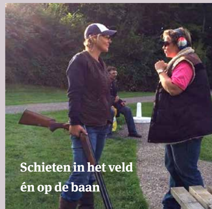
Schieten in het veld én op de baan

Heb geduld met het schieten van deze duif. Hoe eerder je de inkomende duif schiet, hoe groter de afstand die de hagel moet afleggen, dus dat betekent dat je meer voorgift moet geven. Hoe langer je wacht met het schieten van deze duif, hoe makkelijker het wordt. De duif is dichterbij en de voorgift wordt steeds kleiner.