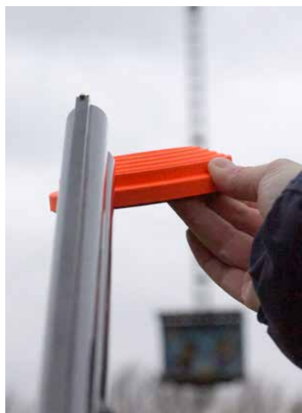
Duif inhalen en daarna de trekker overhalen