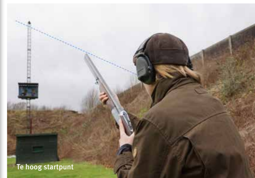
Te hoog startpunt