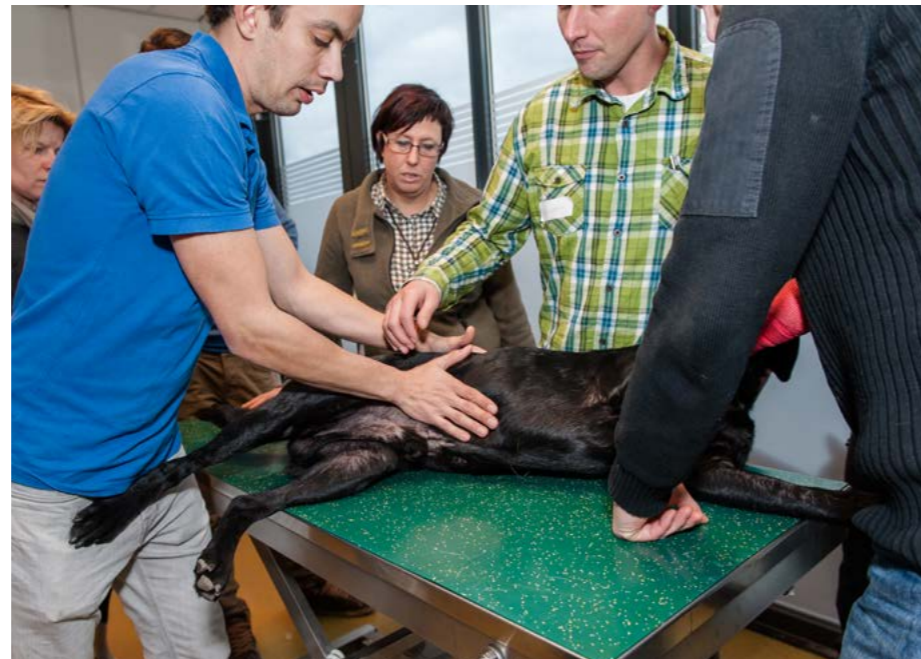
Plaats beide handen op de buik net achter de ribben

Wikkel het lichaam, inclusief de poten, in een doek. Zorg dat de hond rustig blijft. Open zijn bek. Steun met de muis van uw hand op de onderste hoektanden en verwijder het voorwerp uit de keel. Pas op met haken en visdraden, die kunnen doorlopen tot de maag. Is de hond al bewusteloos, houdt hem dan aan zijn achterpoten vast en schud hem met de kop naar beneden. Werkt dit niet, leg de hond dan op een zij en duw met beide handen op de buik net achter de ribben in de richting van de kop. Als ook dit niet werkt, wissel dan het duwen af met beademing en hartmassage (zie deel 1).