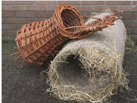
Een ambachtelijk te broedkorven en een hooggevalde gaasrol naar Engels-Amerikaans voorbeeld.

In het vorige artikel heeft u kunnen lezen over nut, noodzaak en schoonheid van broedkorven. In dit artikel gaan we verder in op de noodzaak van broedkorven en worden aanvullende tips gegeven voor de plaatsing en de nazorg van de eendenkuikens. Ook nemen we een kijkje in Groot-Brittannië en Amerika, waar men al jaren werkt aan het verhogen van het broedsucces van eenden met hooggevalde gaasrollen. Deze techniek wordt ook meegenomen in het project van de KNJV om te experimenteren met broedkorven. We nodigen u ook van harte uit om mee te doen!