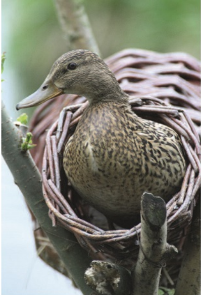
Tekst: Reinier Erzerink

De eenden in de Nederlandse jachtwieden krijgen deels met vergelijkbare problemen te maken als de weidevogels, een veranderend agrarisch landschap en toenemende predatie. Beide soorten moeten het hebben van ruige randen en rustige hoekjes in het agrarisch landschap, die steeds schaarser worden naarmate de landbouw intensiever wordt. Tegelijkertijd, wellicht in samenhang met de veranderende landbouw, neemt de predatie toe. De kunstmatige broedmogelijkheden voor eenden, zoals de broedkorven en de gaasrollen, helpen om predatie van de nesten te verminderen, mits goed geplaatst. Om een project ten behoeve van het broedsucces van eenden te laten slagen, moet de jager ook veel energie steken in predatorbestrijding.