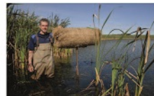
Een lid van de Canadese Det tawa terfowl organisatie plaatst een zogeheten 'Mallard Factory'

Nederland ook werken? Daar hopen we dit jaar samen met u achter te komen. De redactie van De Nederlandse Jager maakte tien 'eendenfabrieken' naar Amerikaans voorbeeld en zal deze plaatsen om te ontdekken of de Nederlandse eenden deze creaties net zo weten te waarderen als hun Amerikaanse soortgenoten. Experimenteer met u met ons mee!